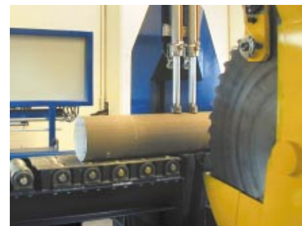
Säge · Saw