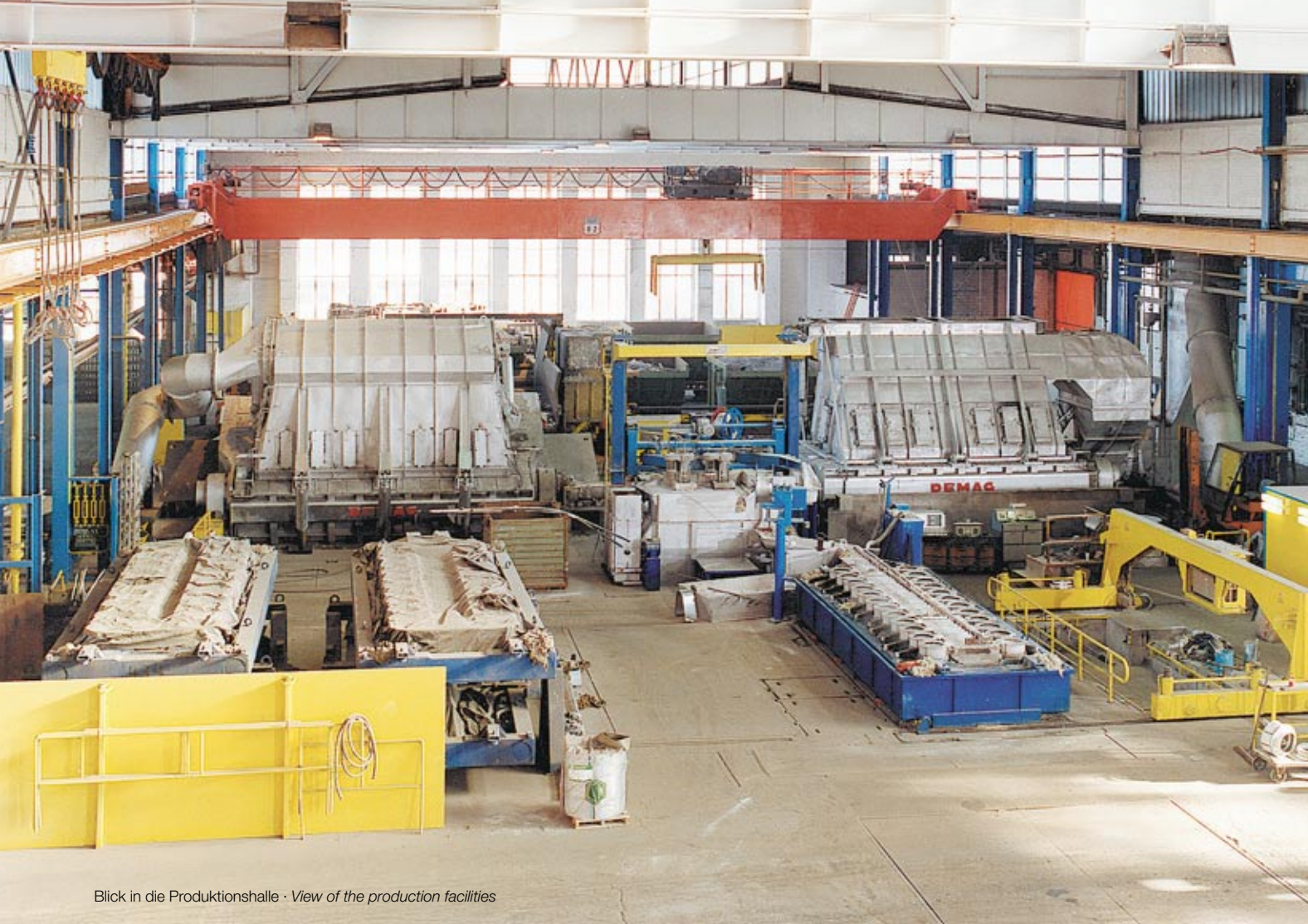
Blick in die Produktionshalle · View of the production facilities