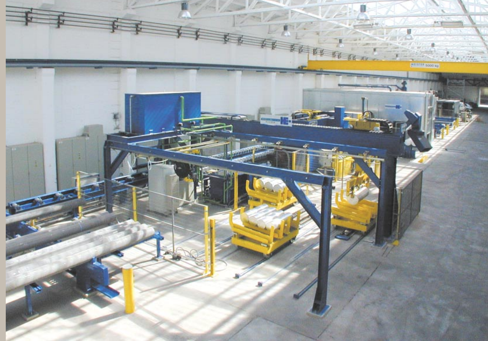
Barrenbearbeitungscenter · Billet processing center