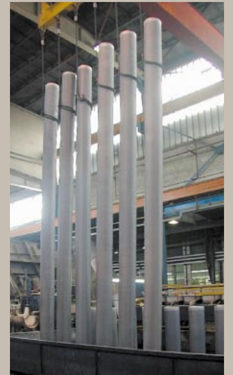
Entnahme der Gusscharge · Metal tapping

Alle Rundbarren werden in gasbeheizten Homogenisierungsöfen bei maximalen Temperaturschwankungen von \pm 4^\circ\text{C} wärmebehandelt.