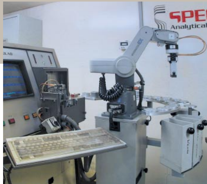
Spektrometer · Spectrometer