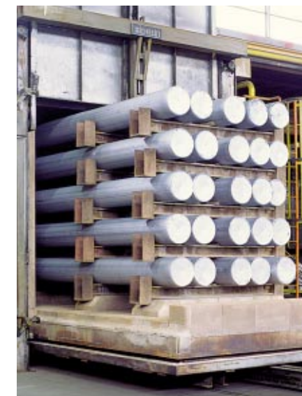
Homogenisierungsöfen · Homogenising furnace

Our customers include forges, extrusion plants and rolling mills count among as well as companies trading in semi-fabricated products. As a subsidiary of Hydro Aluminium Deutschland GmbH, Sector: Metal Products, the Hanover foundry is part of one of the most important aluminium companies in Europe.